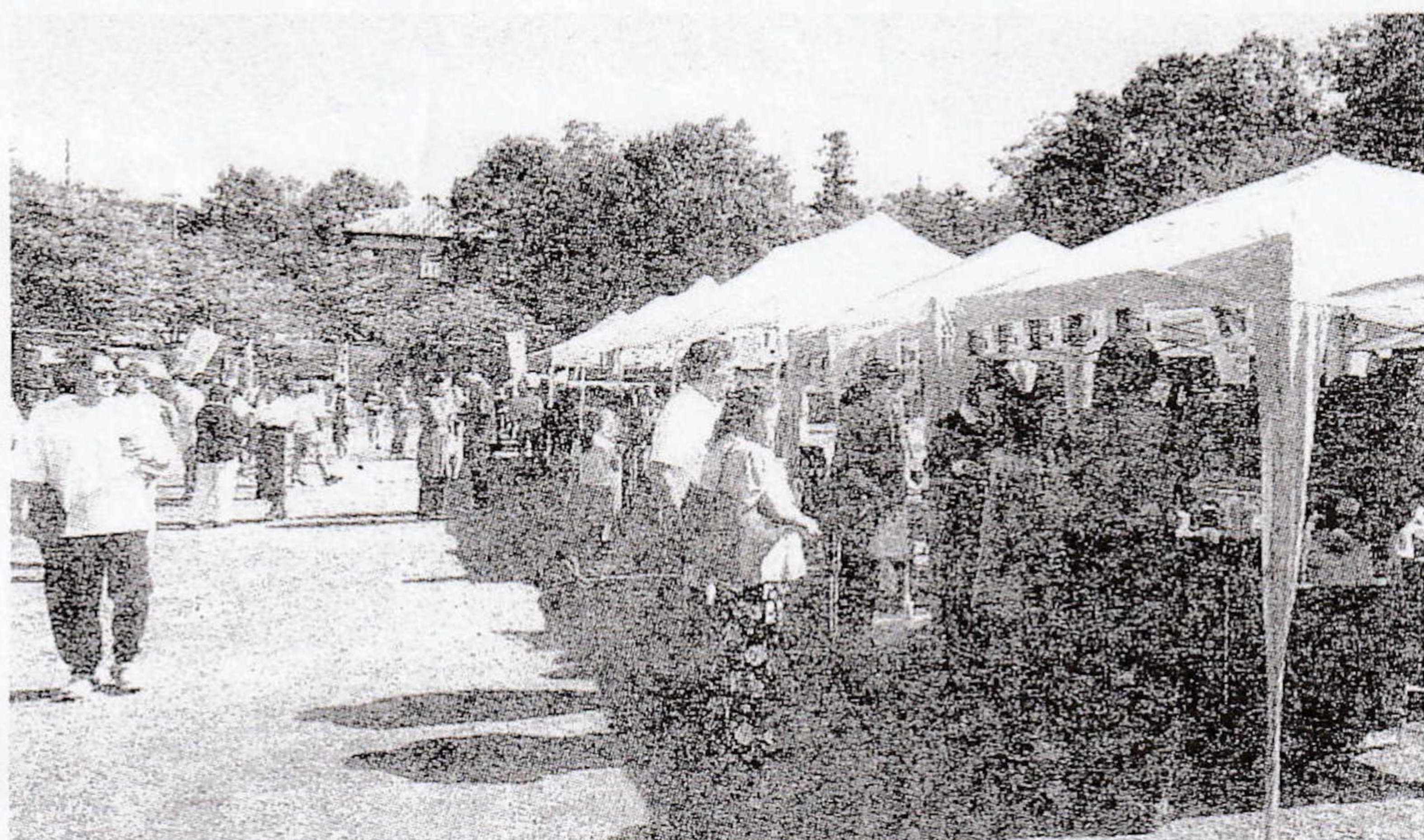
にぎわう会場。食文化を感じながら飲食を楽しんだ

企画したきつかけについて「養蚕で北イタリアと歴史的つながりを持ち、ラグビーワールドカップ2019ではイタリアチームが菅平で事前合宿を