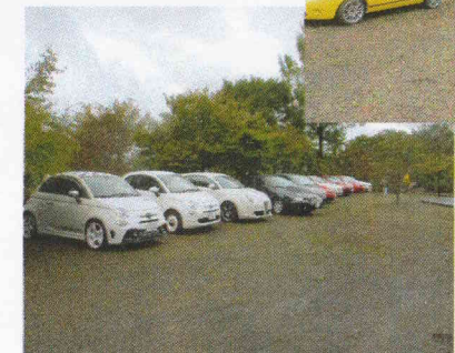
フィアット長野 / オーナーズクラブの皆様のご協力によるイタリア車の展示