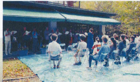
野外ステージでは地元の方の合唱、コカリナ演奏、軽音楽の演奏