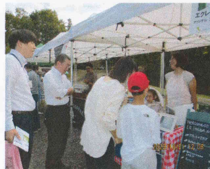
上田市長も来場下さり楽しそうに回られていました