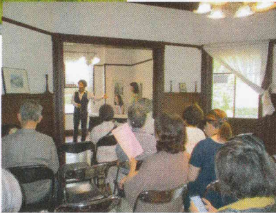
歴史を感じる旧宣教師館でのカンツォーネ