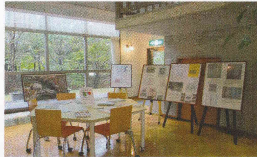
メインロビーではイタリア紹介と蚕都上田のパネル展