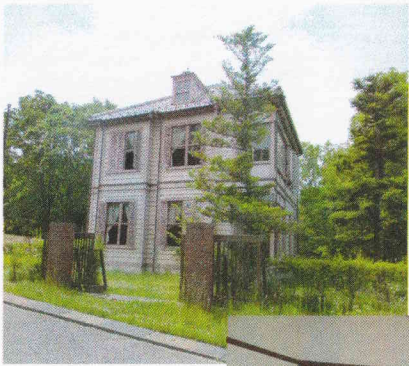
明治33年建築の 旧宣教師館