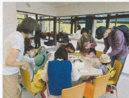
まゆを使っのワークショップ