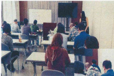
大盛況だった簡単イタリア語教室