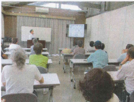
講演「海を渡った上田の蚕種商人」