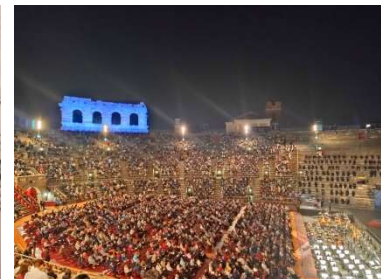
収容 15,000 人のうち、 約 3 千人までの入場制限

20 : 45 開演、そこから 3 時間。小学校に入ったくらいの子どもも観に来ています。