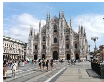
人より鳩が多い Duomo 前