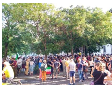
Duomo から東へ 100m Piazza Fontana ミラノ最初の噴水(18世紀)がある歴史的な広場