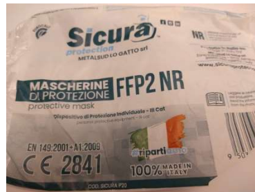
指定のマスク FFP2 1枚 1euro くらいです