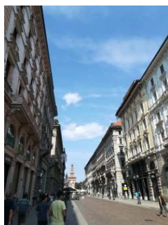
ダンテ通りもスカスカ