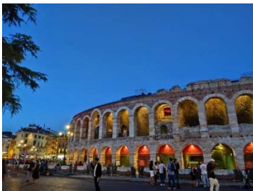
柵の奥でグリーンパスチェック

(IT) Dal 6 Agosto 2021 saranno necessari Green Pass e mascherina FFP2 per accedere agli spettacoli in Arena