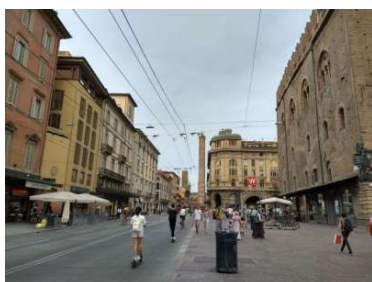
リッツオリ通り、正面は斜塔です。 8/10 19時

ボローニャといえばボローネーゼ。サッカー日本代表の富安選手が所属しているクラブのある町であり、中田英寿元選手が所属していたのももうすぐ20年前になります。グリーンパス発行前でしたので街並みを見るだけに留まりましたが、ポルティコというアーケードの形が印象的でした。泊まったホテルのフロントの方が東京の大学に留学されていたそうで、日本語で市内の観光情報やオススメの料理店を教えてくださいました👍