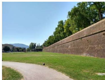
街を囲む城壁 上田城のやぐら下芝生広場っぽい!?