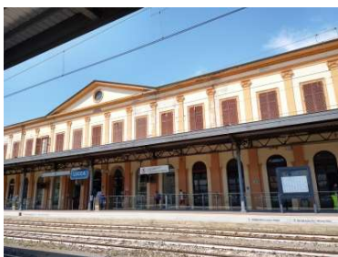
ほぼ無人の LUCCA 駅 8/20 14 時半

都市を周囲 4km の城壁が囲んでいます。あまりの暑さに駅にも城壁にも誰もいません。