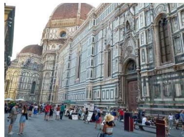
大聖堂北側 ここまで入場待ちが続いています

グリーンバスが有効になる日付がハッキリしないため、各文化施設の予約が直前になってしまいました。それでもチケットが取れるくらいです。