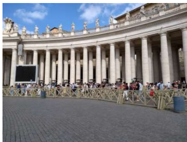
サン・ピエトロ広場 8/17 9時半

美術館チケットは既に現地ツアー会社によって確保されている状況でしたので、そのツアーから入場案内代込みで正規価格+10ユーロで買うことになりました。。背に腹は代えられぬ、と入館を優先し美術館へ乗り込みました。