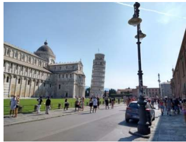
ドゥオーモ広場 写真右側の道路沿いに 土産店はほとんどありません。