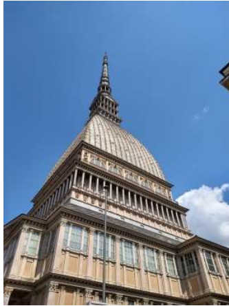
モーレ・アントネリアーナ