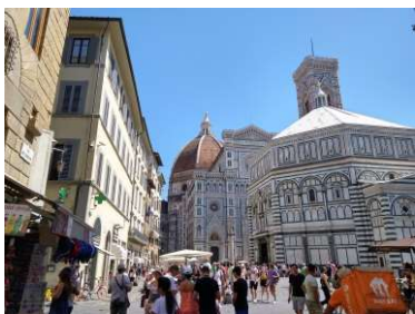
サン・ジョヴァンニ広場 8/19 13時 ランチタイムのため、人は少なめ

サンタ・マリア・ノヴェッラ薬局では店員の方から日本語で話しかけられましたが、こちらは日本への留学で習得された日本語でした。母国語での会話は楽で良いですね。