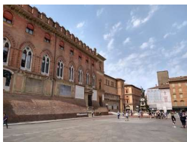
マッジョーレ広場 8/10 14時