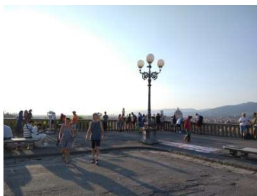
19時 人が増えていきます