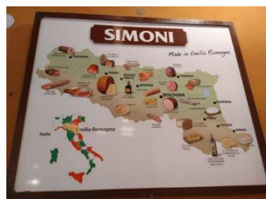
Salumeria Simoni の看板 エミリア・ロマーニャの名産が一目で分かる素晴らしい地図🏠🍷