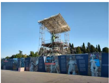
ミケランジェロ広場のダビデ像