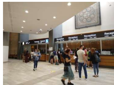
美術館チケット売り場 11時