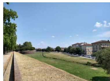
城壁の上からです。上はサイクリング ロードにもなっています。