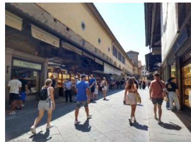
ヴェッキオ橋北側 8/11 13時 夕方はもう少し賑わっていました