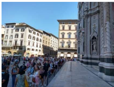
大聖堂入口前 8/21 11時 朝から 入場待ちの行列ができていました