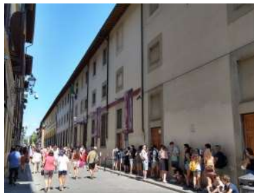
アカデミア美術館前 8/19 14時 前日のチケット残数は約30