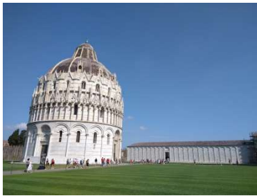
サンジョバンニの洗礼堂 8/20 10 時半

Pizza と Piazza(広場)の区別ができずにモヤモヤしていた頃より成長しているようです😊