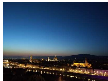
21時 人もまばらになってきました。