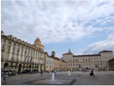
トリノ王宮前広場 8/25 11時

2006年の冬季オリンピック開催地、その年の流行語にも選ばれた「イナバウアー」の荒川静香さん金メダルの地です。イナバウアーといえば、トゥーランドット(Turandot)。Luccaでプッチーニ生家を訪れたことで、音楽分野に疎い私でも教養が身につきました👍 Euro2020でイタリア国家を教えてくれた鬼教官の同僚は音楽に少しうるさいので、これでブーブー言われることは恐らくないでしょう。。。👍