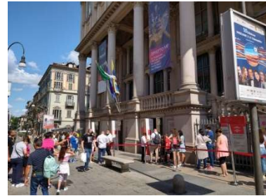
そのモーレ・アントネリアーナ前