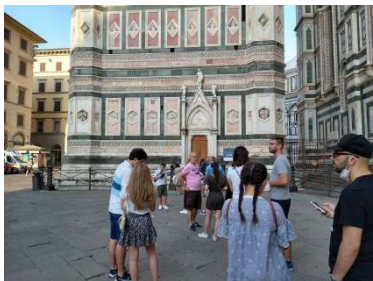
ジョットの鐘楼下 8/22 8時 一番早い8時半からの回に予約済。 前日でもチケット残数は約50でした

グリーンバスが有効になる日付がハッキリしないため、各文化施設の予約が直前になってしまいました。それでもチケットが取れるくらいです。