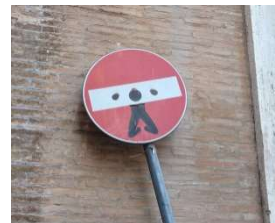
👍👍 Roma にて